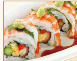
海老ロール Shrimp Roll