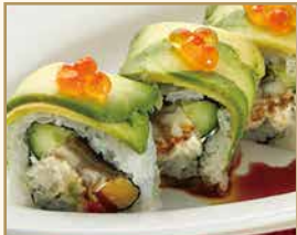
ドラゴンロール Dragon Roll