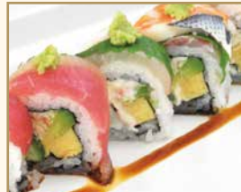
レインボーロール Rainbow Roll