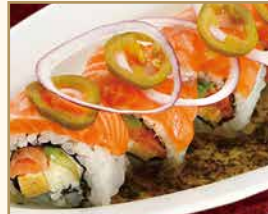
フィラデルフィア ロール Philadelphia Roll