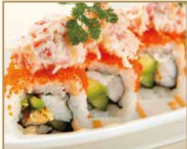
カリフォルニアロール California Roll