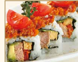
スパイシーチキン ロール Spicy Chicken Roll