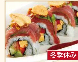
土佐ロール Tosa Roll