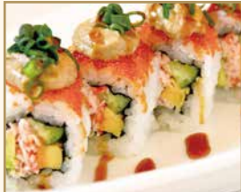
カリフォルニアロール 蟹みそソース California Roll with Kanimiso