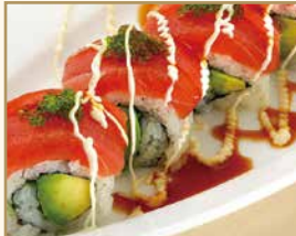
まぐろアボカド ロール Tuna Avocado Roll