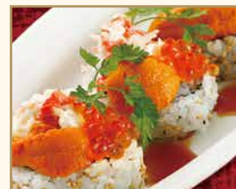
北海道産 Hokkai Roll