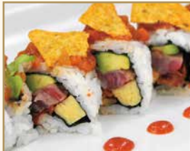
メキシカンロール Mexican Roll