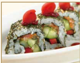
梅ロール Plum Roll