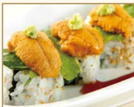
北海道産 うにロール Sea Urchin Roll