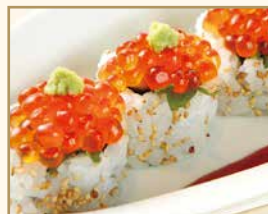
三陸いくらロール Salmon Roe Roll