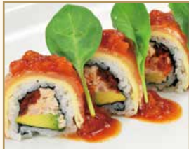
イタリアンロール Italian Roll