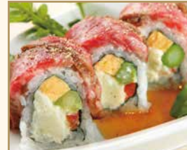
和牛ロール Wagyu Roll